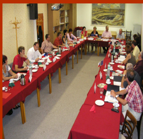
První jednání Rady RP BAD - ART 8/2008